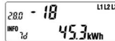
Historische Werte seit letzter Rückstellung