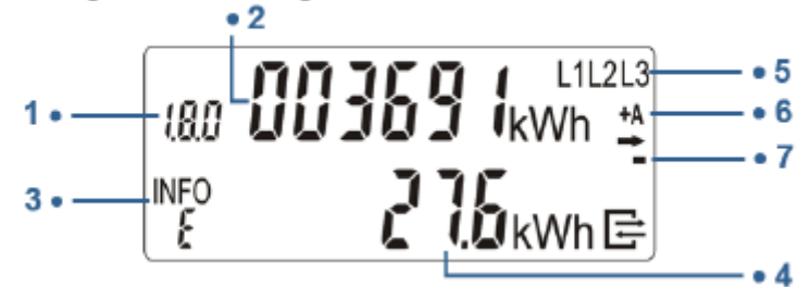
Anzeige und Bedienung

Die Spannungsversorgung des Zählers L1-L2-L3 wird graphisch angezeigt.